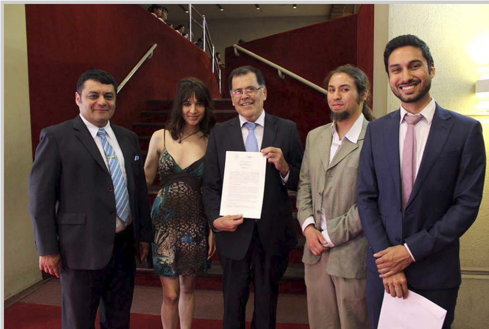
Facultad de Ciencias Físicas y Matemáticas de la Universidad de Chile

Dicho acuerdo se fraguó luego que se detectara que al menos 40 diputados pagaron por informes plagiados entre 2014 y 2016, entre los cuales figuraban documentos copiados textualmente de internet o con fuentes sin citar. Por ello el Congreso debió recurrir a esta herramienta creada por la Universidad de Chile y que ya ha desarrollado su tercera versión.